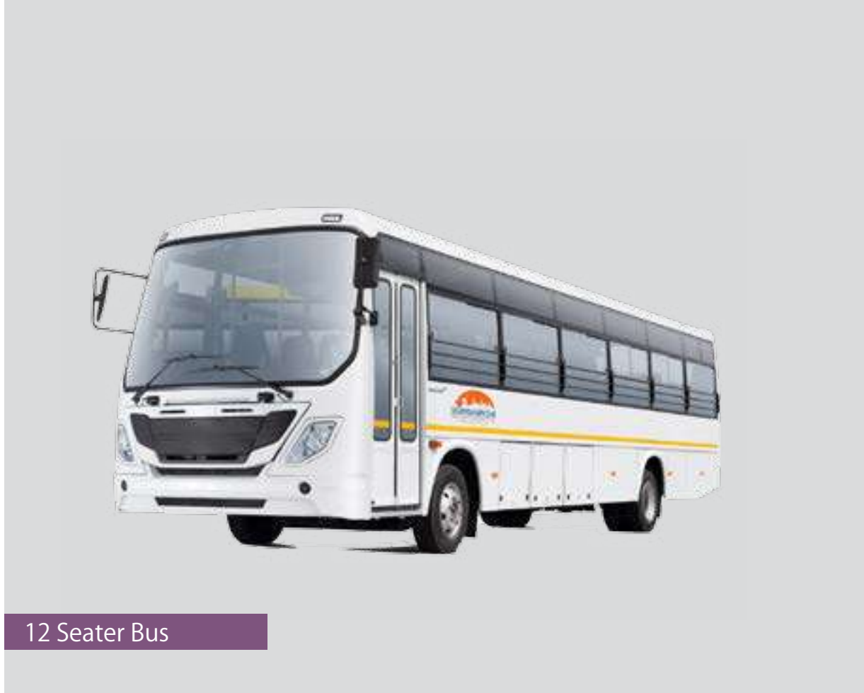
12 Seater Bus

పెరుగుతున్న నగర ప్రజల నివాస అవసరాలకు అనుగుణంగా “స్కంధాన్ని ఆరంభ”ను తీర్చిదిద్దుతున్నాము. మీరు వెచ్చించే ధర అతి వేగంగా రెట్టింపు మరియు అభివృద్ధికి అవకాశం కలిగిన స్థలం. “స్కంధాన్ని ఆరంభ” లో ఫ్లాటు లేదా హౌస్ తీసుకున్న, మా ఖాతాదారుల రవాణా సౌకర్యార్థం వెంచర్ నుండి షాడ్ నగర్ మరియు ప్రధాన రహదారికి వెళ్ళుటకు పటిల్ సర్వీస్ బస్సు ఏర్పాటు చేయడం జరుగుతుంది. ఖాతాదారుల ప్రయాణ సౌలభ్యం కొరకు ఉచితముగా బస్ షెల్టర్స్ కూడా నిర్మించబడుతాయి.