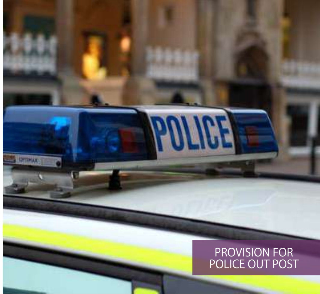
PROVISION FOR POLICE OUT POST