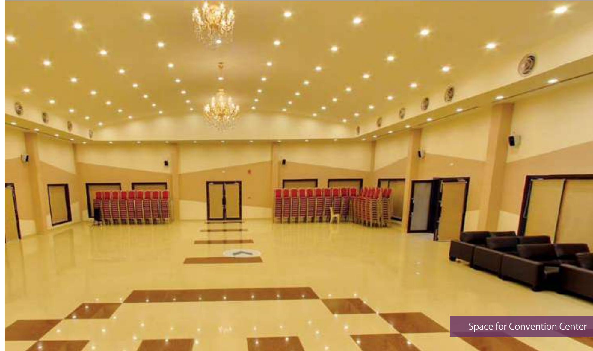
Space for Convention Center

మీ బంగారు భవిష్యత్తుకి బాటలు వేసే దిశగా ఒక ప్రత్యేక స్థలాన్ని స్కంధాన్ని “ఆరంభ”లో కేటాయించడం జరిగింది. వేడుక ఎదైనా వేదిక ఎదైనా ఒక్కటే అవ్వాలనే సంకల్పంతో అలాగే మెరుగైన విద్య, వైద్యం అందించాలనే లక్ష్యంతో ప్రత్యేకంగా స్థలం ఎర్పాటు జరుగుతుంది. ఈ ప్రత్యేక స్థలాన్ని కేవలం ఈ మూడింటి నిర్మాణాల కొరకు ఏర్పాటు జరుగుతుంది. సామాన్యూడి నిత్యావసరాలను దృష్టిలో పెట్టుకొని, అభివృద్ధికి చిహ్నమైన వీటి నిర్మాణం కోసం మన స్కంధాన్ని వారు స్థలం తక్కువ ధరకే విక్రయించడం ద్వారా విద్యావేత్తలకు, వ్యాపార వేత్తలకు ఒక అద్భుతమైన అవకాశాన్ని కల్పిస్తుంది. నేటి వరకు ఎన్నో చెప్పకోదగిన వెంచర్లను ప్రజల ముందింది. ఎన్నో కుటుంబాలలో చిరునవ్వులు పూయిస్తున్న “స్కంధాన్ని” వారి దృఢ సంకల్పమే ఈ ప్రత్యేక స్థలం.