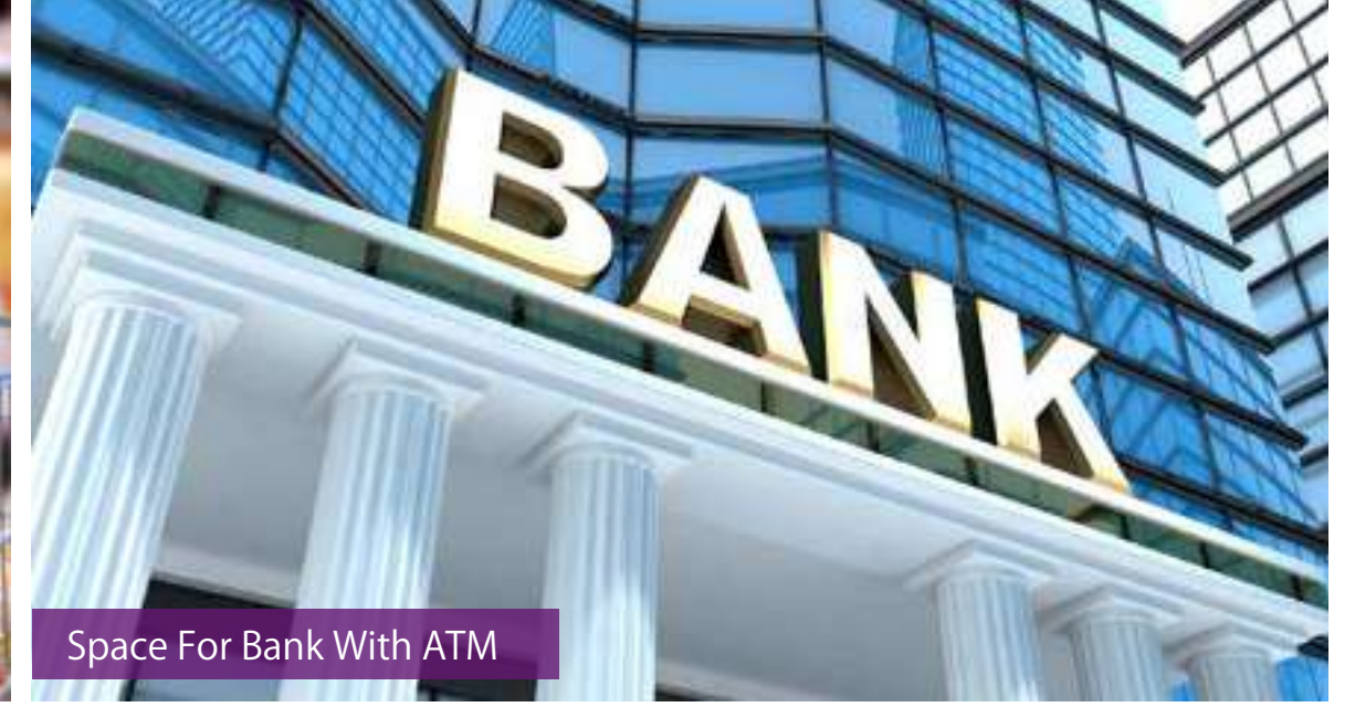
Space For Bank With ATM