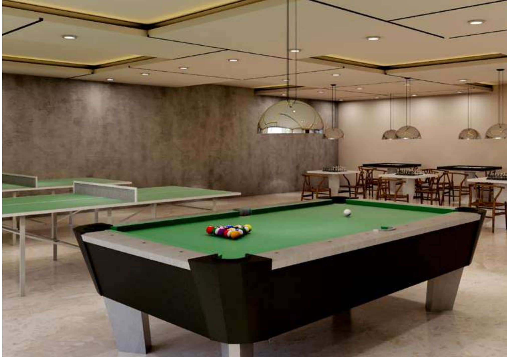
Indoor Games in Multi Utility Hall

శారీరక ఆరోగ్యమే కాదు, మనిషికి మానసిక ఆరోగ్యం కూడా ఎంతో అవసరం. చెస్, క్యూరమ్స్, టేబుల్ టెన్నిస్ లాంటి ఇండోర్ గేమ్స్ వలన, మీ ఏకాగ్రతతో పాటు మానసిక ప్రశాంతతని పొందుతారనటంలో ఆశ్చర్యం లేదు. టేబుల్ టెన్నిస్, బిలియర్డ్స్ లాంటి ఇండోర్ గేమ్స్ కొందరికి మాత్రమే అందుబాటులో ఉన్న ఆటలు. ఇటువంటి ఆటలపై ఆసక్తిని పెంచి మీ అందరికీ చేరువ చేయాలనే ఉద్దేశ్యంతో, ఆరంభలో ఈ ఆటలను ఆడుకునే సదుపాయాలను మీకు అందిస్తుంది.