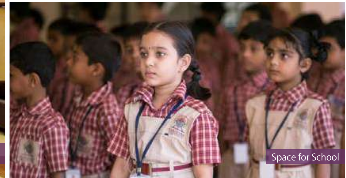
Space for School