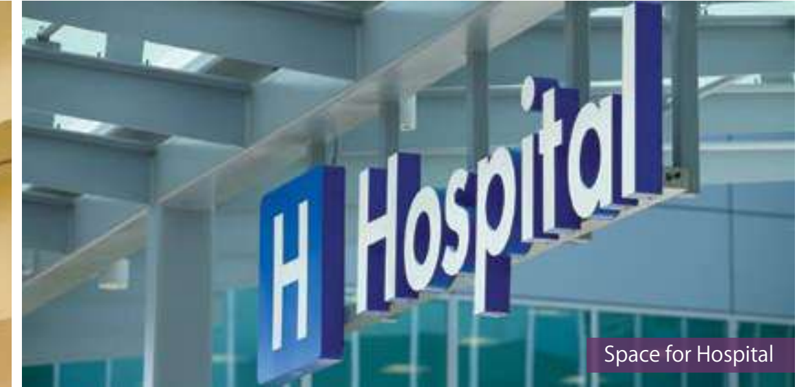
Space for Hospital