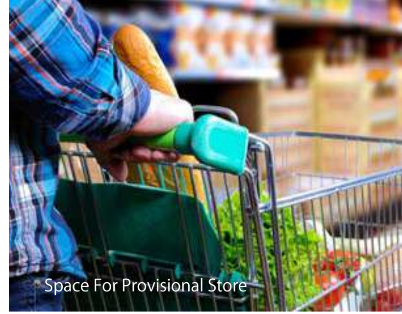
Space For Provisional Store