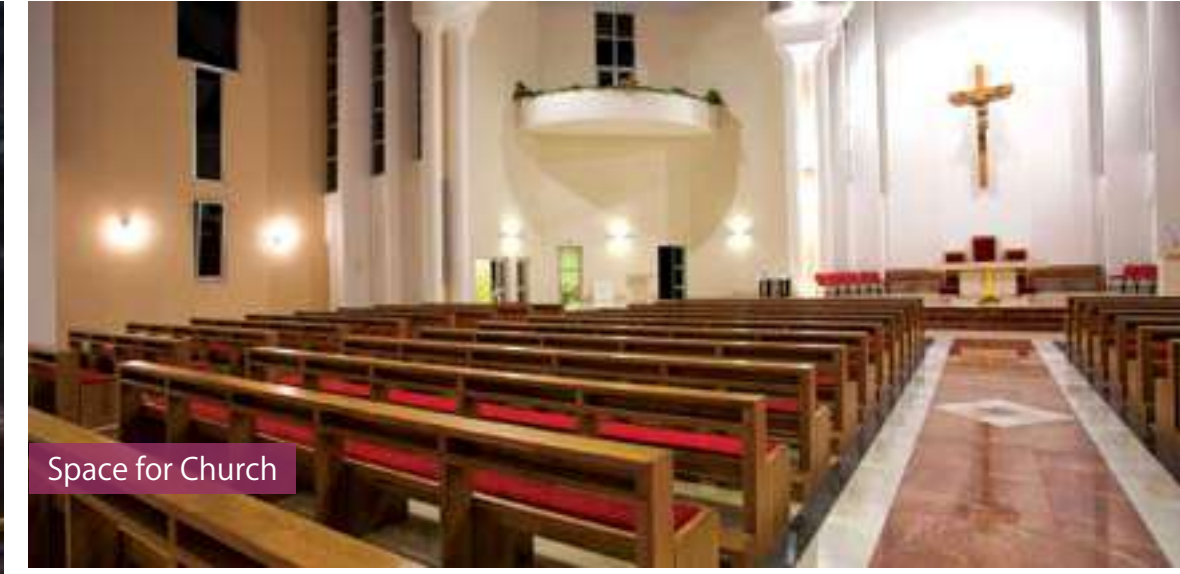
Space for Church