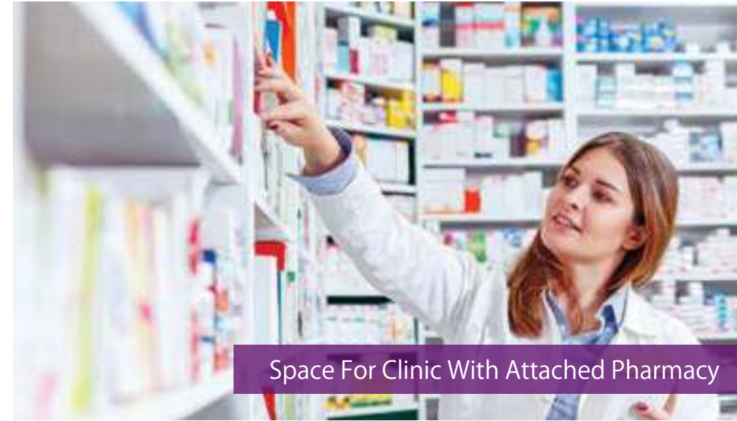
Space For Clinic With Attached Pharmacy