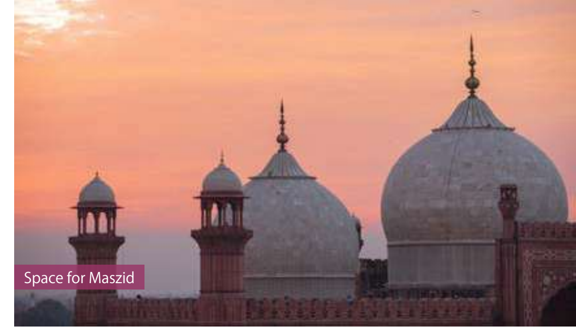
Space for Masjid

నిరంతరం బీజీగా గడుపుతున్న ప్రజల మనసులో ప్రశాంతతను నింపడంకోసం, ఖాతాదారుల మత విశ్వాసాలకు, వారి మనోభావాలకు విలువనిస్తూ మన స్కంధాన్ని ఆరంభంలో హిందువులకు దేవాలయాలు, క్రైస్తవులకు చర్చ్ మరియు ముస్లింలకు మసీదు లాంటి ప్రార్థనామందిరాలను నిర్మించటం కొరకు ప్రత్యేకమైన స్థలం కేటాయించటం జరిగింది. దేవాలయ నిర్మాణాలు, సాంస్కృతిక సంప్రదాయాలకు ప్రతీకలు అని స్కంధాన్ని విశ్వసిస్తుంది.