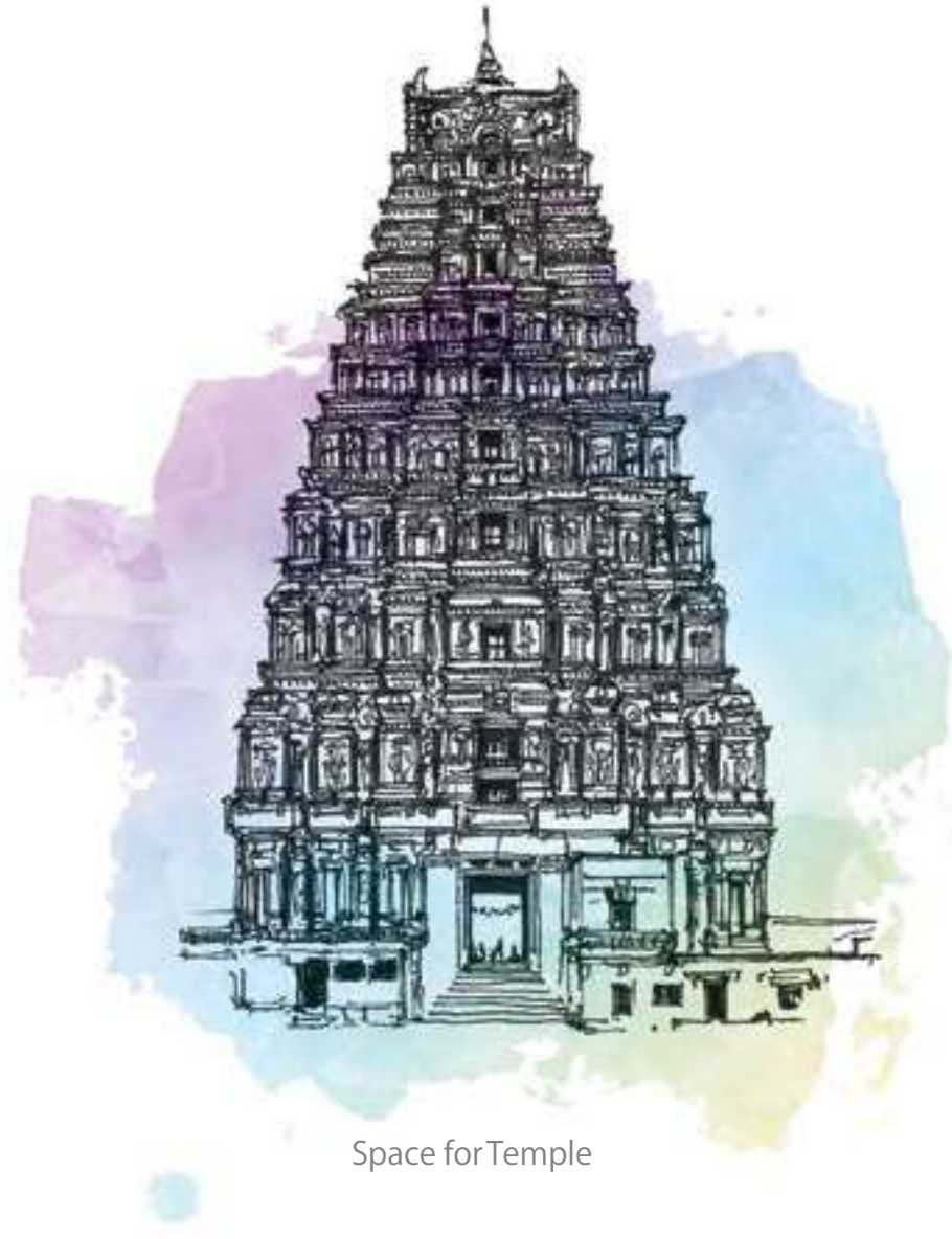
Space for Temple