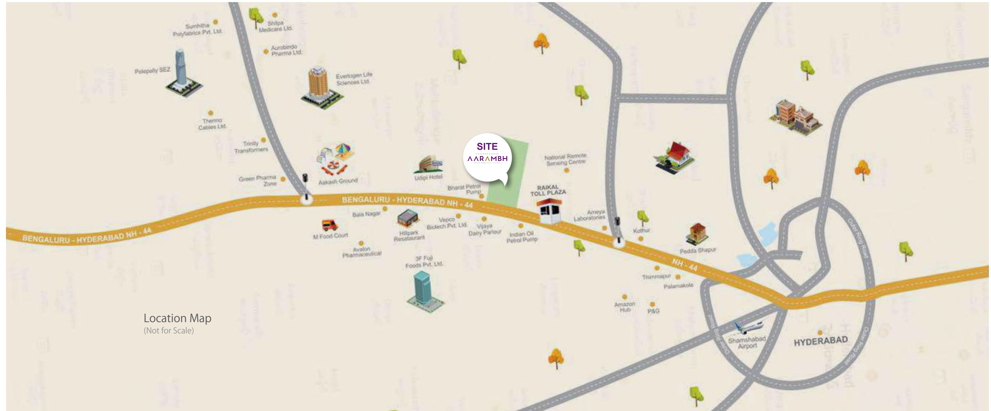
Location Map (Not for Scale)

HR LINES ARCHITECTURE 1342 A, Rd No.67, Jubilee Hills, Hyderabad