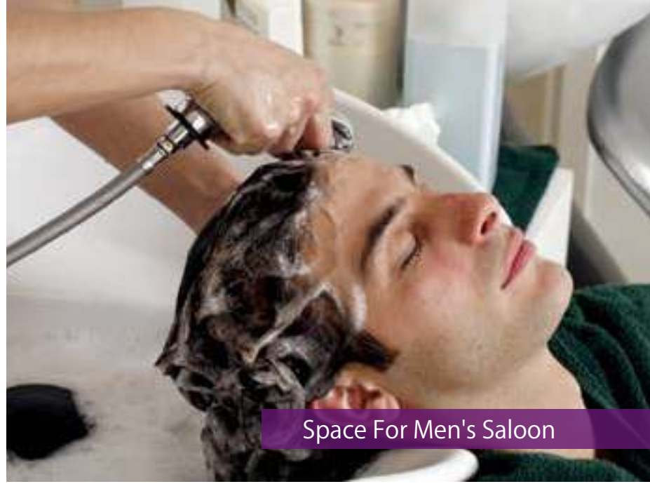
Space For Men's Saloon

ప్రతి సౌకర్యం ఖాతాదారులకు అందుబాటులో ఉండాలనేదే స్కంధాన్ని ప్రధాన లక్ష్యం. అందుకే వెంచర్లో మెన్స్ సెలూన్, బ్యూటీ పార్లర్, ప్రోవిజనల్ స్టోర్, బ్యాంక్ విత్ ఎ.టి.యమ్ మరియు క్లీనిక్ విత్ ఎటాచ్డ్ మెడికల్ స్టోర్ల కోసం ఆసక్తి కలిగిన వారికి 5 సంవత్సరాలు ఉచితముగా లీజుకు ఇవ్వడం జరుగుతుంది. ఎందుకంటే అన్ని వసతులు మన ముంగిట్లో ఉన్నప్పుడే నిజమైన అభివృద్ధి అని స్కంధాన్ని ప్రగాడ విశ్వాసం.