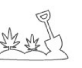
పార్క్ మరియు మొక్కల పెంపకం