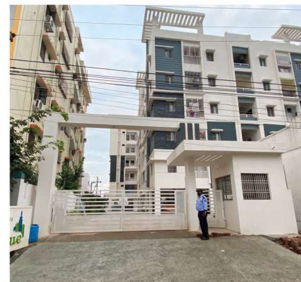
PARK AVENUE 2&3 BHK FLATS @ KURNOOL.