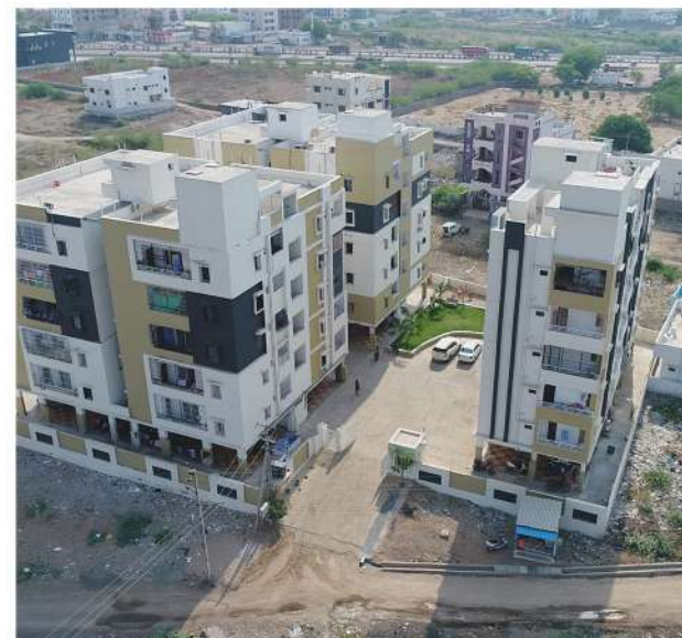
HARMONY 2&3 BHK FLATS @ KURNOOL.