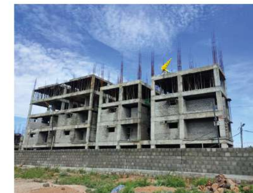
RAMBO PLATINA 2&3BHK FLATS @ ANANTAPUR