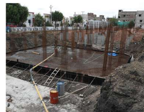
HIBISCUS 2 BHK FLATS @ KURNOOL.