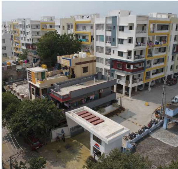
TOWERS 2&3 BHK FLATS @ KURNOOL.