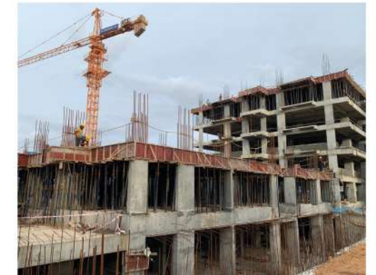
CLOUD 9 2&3 BHK LUXURY FLATS @ KURNOOL.