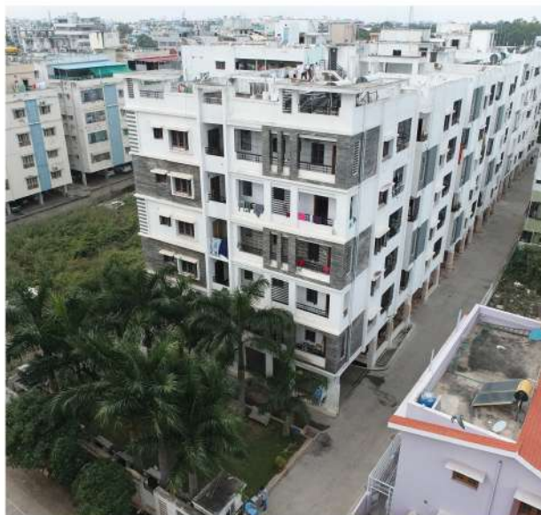
PARK VIEW 2&3 BHK FLATS @ KURNOOL.