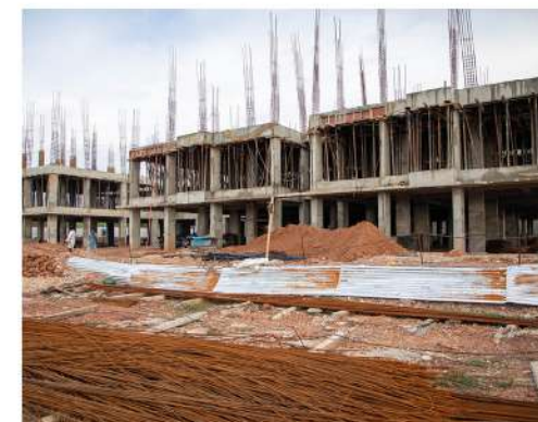
GOKULAM 3 BHK LUXURY FLATS @ KURNOOL.