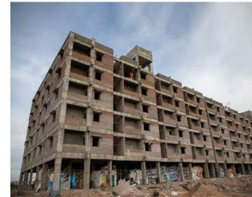
SREE AISHWARYAM 2&3 BHK FLATS @ KURNOOL.