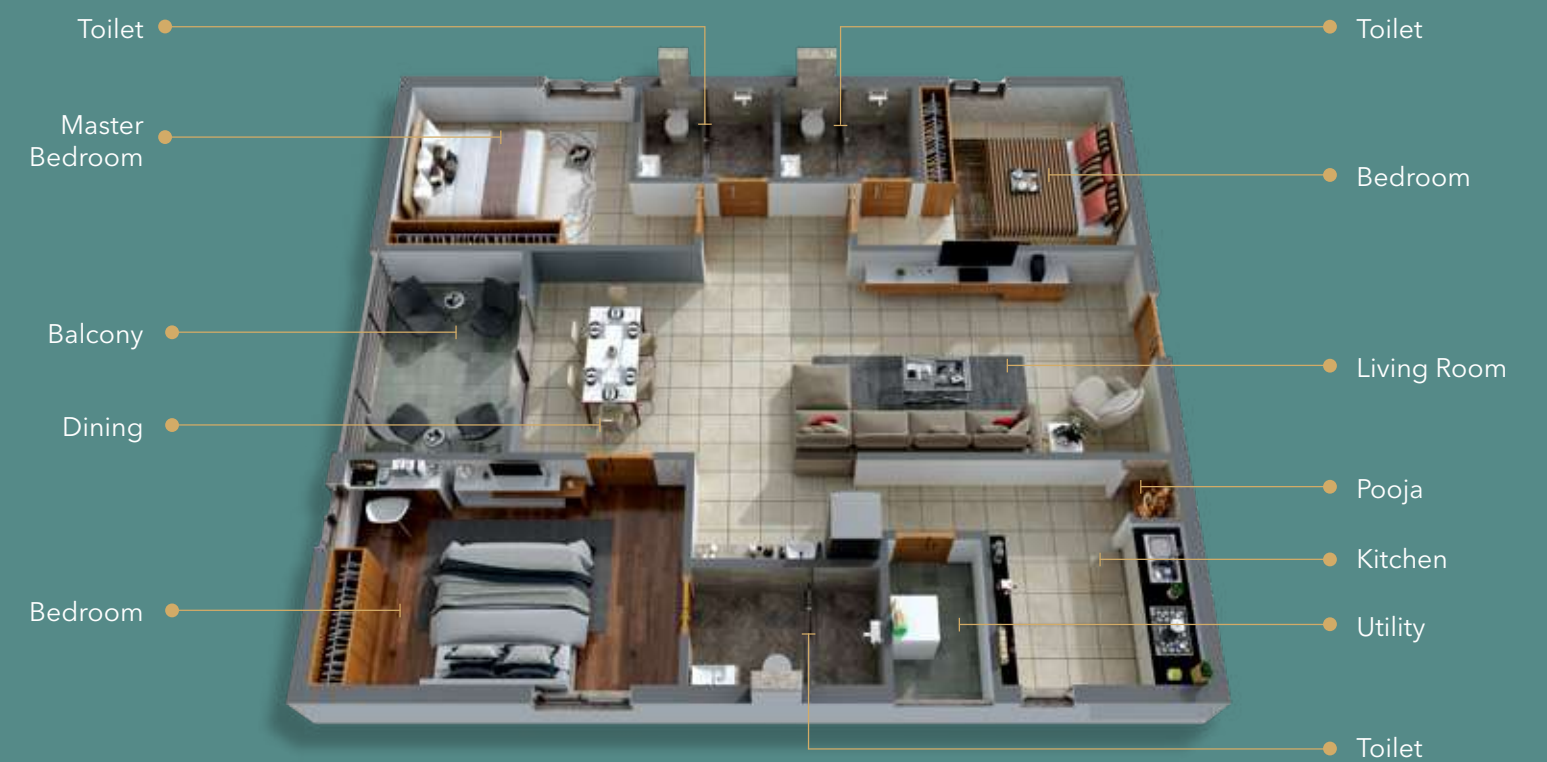
(3BHK) 3D VIEW

ఇరుకు ఇరుకు గదులు చక్కని వెంటిలేషన్, సరైన సౌకర్యాలు లేకపోవడం వల్ల కొంతమంది అపార్ట్‌మెంట్ సంస్కృతిని ఇష్టపడే వాళ్ళు కాదు. ఆ అపోహని స్పృహని పూర్తిగా తొలగించింది. దీనికి సాక్ష్యం స్పృహని గతంలో నిర్మించిన అపార్ట్‌మెంట్ నిర్మాణాలే. 100% వాస్తుతో చక్కని నిర్మాణ విలువలతో, ఇండివిడ్యుయల్ హౌస్‌ని తలపించేలా ప్రతి ఫ్లాట్‌కి వెంటిలేషన్ ఉండేలా, బిల్డింగ్స్ ప్లే ఏరియా, మినరల్ వాటర్ ప్లాంట్, సోలార్ ఫెన్సింగ్ లాంటి మరెన్నో సౌకర్యాలతో “మేం ఫ్లాటినాలో నివసిస్తున్నాం” అని సగర్వంగా చెప్పుకొనేలా రూపుదిద్దుకుంటోంది స్పృహని ఫ్లాటినా.