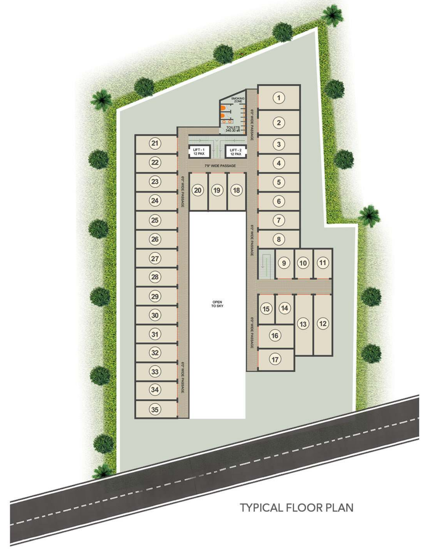
TYPICAL FLOOR PLAN