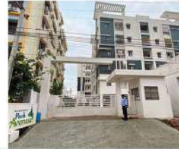
Venture Name: SKANDHANSHI PARK AVENUE Location: A-Camp, Kurnool