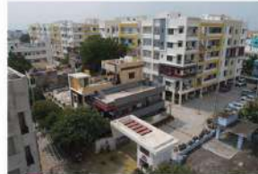
Venture Name: SKANDHANSHI TOWERS Location: Ballari Road, Kurnool