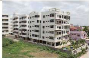
Venture Name: SKANDHANSHI PARK VIEW Location: A-Camp, Kurnool