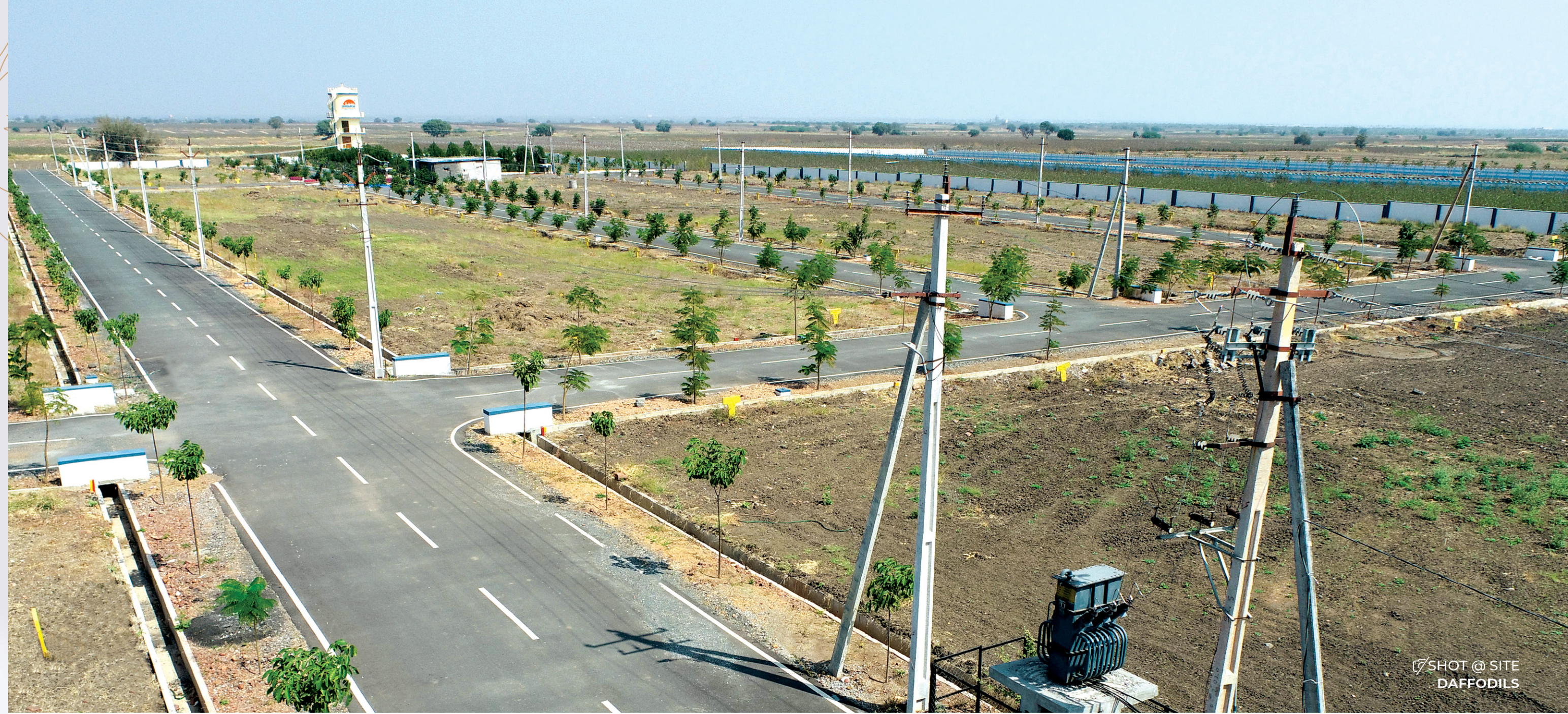
SHOT @ SITE DAFFODILS